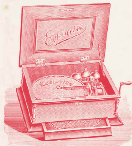
Schatulle N° 3