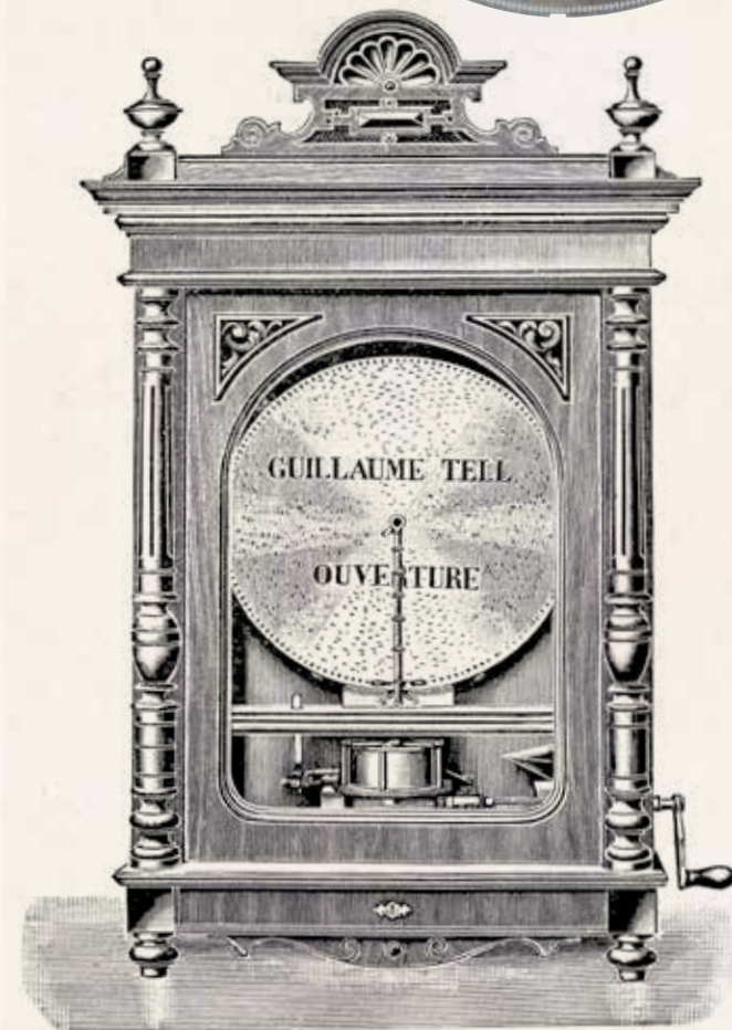
N° 478 B.